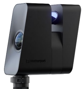
■Matterport Pro3 カメラ