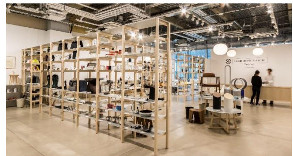
(丸の内店 店内の様子)

弊店は、東京駅・渋谷駅からすぐの場所でグッドデザイン賞受賞アイテムが一堂に会し、美術館のような雰囲気もありながら、モノづくりのこだわりや想いも感じられ、アイテムの価値を再発見しながら買い物体験ができるユニークな場所です。おかげさまで、国内外、老若男女を問わず多くのお客様にご来店いただいております。お客さまが店内を楽しまれる時間が長いのも特長です。