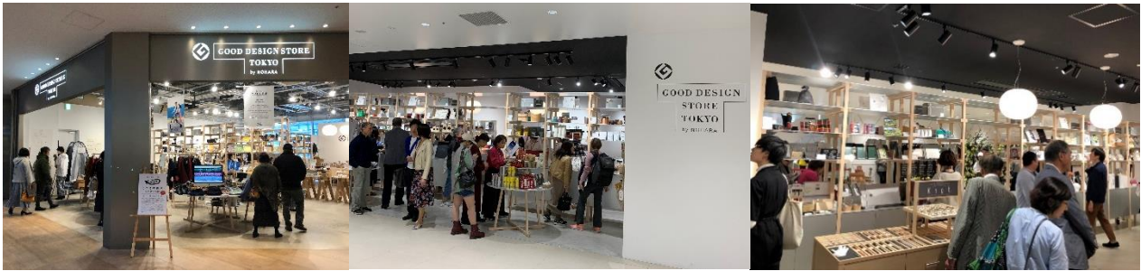
■左：丸の内店の催事の様子、中央・右：渋谷スクランブルスクエア店の賑わい(オープン当時)

丸の内店、渋谷スクランブルスクエア店ともに、テレビや新聞、雑誌など多くのメディアにご紹介いただき、多くの反響をいただいております。