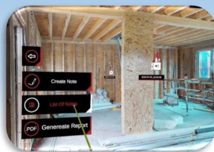
③VRによる最先端の施工管理体験