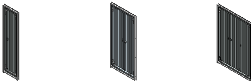
■アイコモンの BIM オブジェクト_左から片開き、両開き、三枚建て

「bimobject.com」への会員登録(無料)後、「1. 掲載場所」よりダウンロードいただけます。