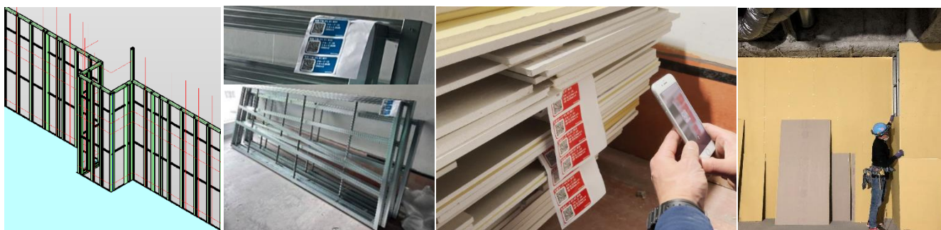
■左から、LGS 配列 BIM モデル、工場で組み立て後現場納入された LGS（QR コードでデータ管理）、設計図書通りに様々なサイズにプレカットされた石膏ボード（納材確認）、技能労働者による LGS の組込や石膏ボードの貼り作業の様子