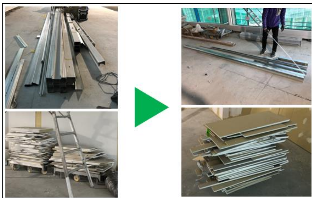
■施工後の現場廃材量の比較_左：従来施工階、右：プレカット施工階 (上段：軽量鉄骨(LGS)乾式壁下地材、下段：石膏ボード)

今後両社では、実証結果と課題を踏まえ、他用途物件での共同実証を継続する予定です。そして、更なる効果創出により、建設業界の「脱炭素」「廃棄物ゼロ」「防災・減災」「サプライチェーン全体における生産性向上」に向けた業界全体の機運醸成に努めてまいります。