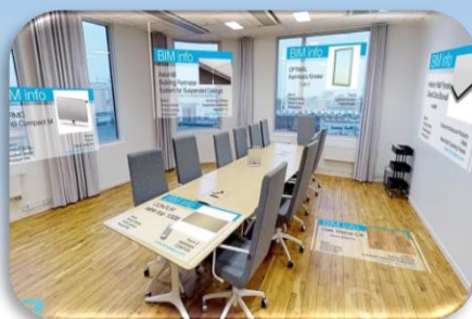
②VR内でBIMオブジェクト活用体験