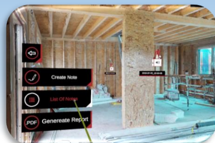
③VRによる最先端の施工管理体験

NOHARA Link ideas. Build future. 思いをつなげ、未来をつくる。