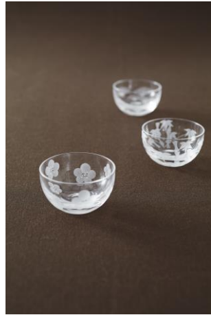
■玻璃匠 山田硝子 / 寿盃 松竹梅 ¥9,936(税込)

江戸時代から続く神輿鍔(かざり)金具を作る鑿(たがね)の技術と模様を活かし、葛飾北斎が書いた図柄や鳥獣戯画を使用したマグネット。