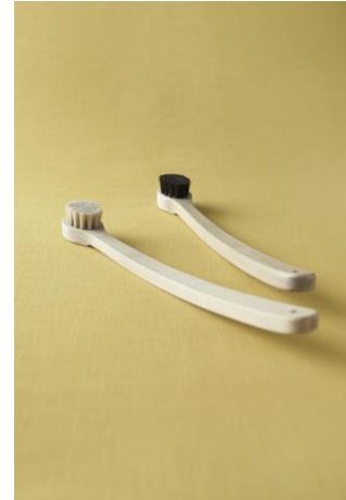
■宇野刷毛ブラシ製作所 / ボディブラシ 中柄たてがみ・花馬 ¥5,400(税込)

透明な硝子に花鳥風月を描く伝統的な切子技法「花切子」で、昔から祝い事に使われる松竹梅を洗練された寿盃に仕立てた。