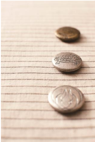
■塩澤製作所 / マグネット「日本お持ち帰り」 ¥2,160(税込)

江戸時代から続く神輿鍔(かざり)金具を作る鑿(たがね)の技術と模様を活かし、葛飾北斎が書いた図柄や鳥獣戯画を使用したマグネット。