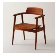
2014年金賞 ダイニングチェア [KISARAGI]

リビングルームは、家族や友人が集まり、団らんや絆を育むための部屋。リラックスした楽しい時間を演出する、選りすぐりの家具や家電、収納用品、デコレーションアイテムを取り揃えました