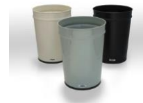
2013年ロングライフデザイン賞 ゴミ箱 [テーパーバケツ]