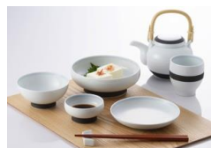
2014年ものづくりデザイン賞 食器 [すみのわ]