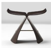
2016年ロングライフデザイン賞 スツール [パタフライツール]