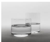
2014年金賞 グラス [ANDO'S GLASS S, ANDO'S GLASS T]

デザインや機能に工夫が凝らされたキッチンツールやテーブルウェアが並ぶダイニングルーム。これまで私たちの食の時間を支えてきた作り手たちの逸品を紹介しします