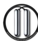
2015年金賞 LED-embedded jump rope [Smart Rope]

子どもから大人まで、すべての人の想像力をかき立て、好奇心をくすぐるホビールーム。時代を超えて支持されているステーションナリーや最新のガジェットなど、発見と楽しさを提案します