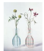
2003年受賞 花器 [D-BROS]