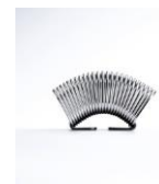
2010年ロングライフデザイン賞 ペーパーホルダー [hane ペーパーホルダー]