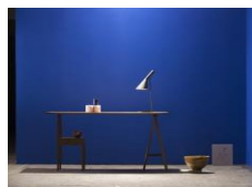
2016年受賞 壁紙 [Who]