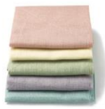
2008年金賞 ふきん [花ふきん]