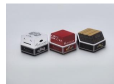
2012年best100 カードゲーム [Rocca(ロッカ)]