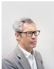
JASPER MORRISON インテリアデザイン

1959年、ロンドン生まれのプロダクトデザイナー。ロンドン王立芸術学院を卒業後、ベルリンにてデザインを学び、1986年にデザイン事務所Office for Designを設立。ロンドン・パリ・東京に拠点を置き、世界中の企業とプロジェクトを手がける。