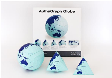
オーサグラフ世界地図 http://www.authagraph.com グッドデザイン大賞 世界地図図法 [オーサグラフ世界地図] http://www.g-mark.org/award/describe/44527