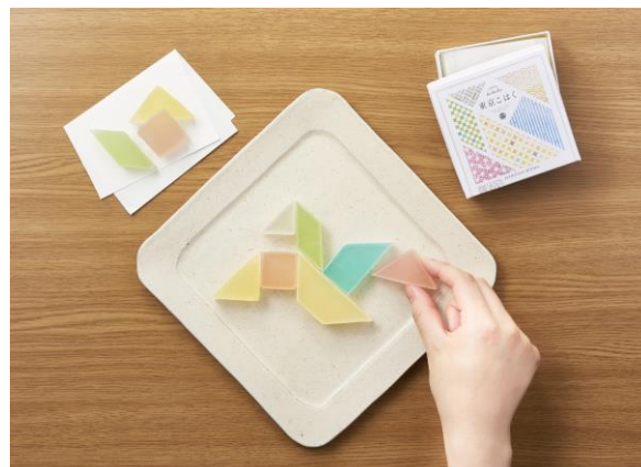
■東京こはく（一心堂本舗） 2018年グッドデザイン賞 / ¥750（税込）