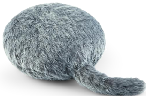
■Qoobo（クーボ）（ユカイ工学+博報堂） 2018年グッドデザイン・ベスト100 / ¥12,960（税込）