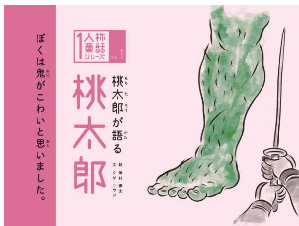
■1人称童話シリーズ（久下裕二） 2018年グッドデザイン・ベスト100 / ¥1,080（税込）