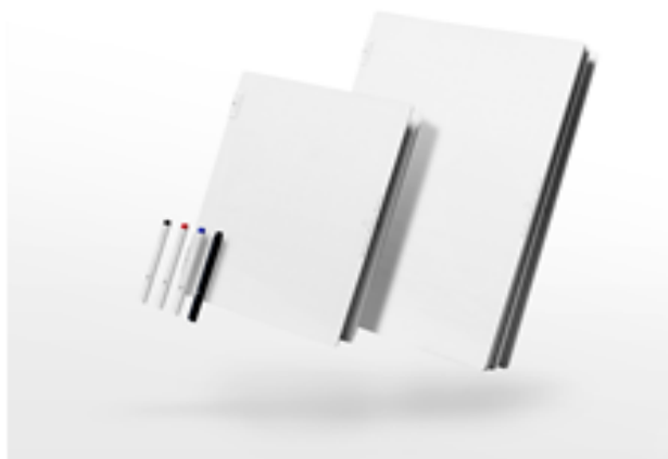
■バタフライボード2（バタフライボード） 2018年グッドデザイン賞 / ¥1,728~¥4,320（税込）