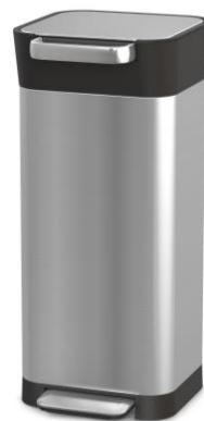
■ジョセフジョセフ クラッシュボックス（Joseph Joseph） 2018年グッドデザイン・ベスト100 / 取扱いは20Lのみ ¥25,920（税込）