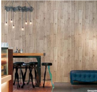
内装仕上げ材(壁紙・岩綿吸音板など)

建材商社として 70 年の歴史をもつ野原グループの資材調達力を活かし、1,000 メーカー以上の建材関連商品を揃えています。ニッチな商材まで網羅しているので、なかなか手に入らない資材もアウンワークスで簡単に見つかります。