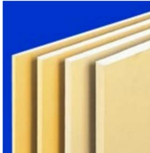
下地材(せっこうボード・断熱材など)