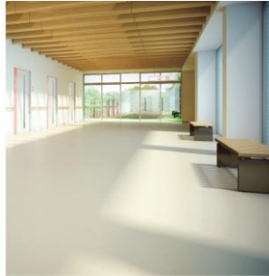
床材(クッションフロア・フロアタイルなど)