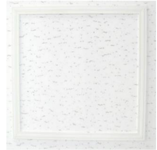
建築用金物(点検口・建具金物など)